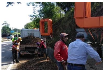
Acondicionamiento y ornato entrada de la ciudad por Av. Ramón Cáceres