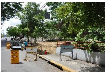
Construcción de gaviones y aceras en el entorno del hospital