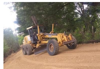
Trabajo en los caminos de El Chofán, Zafarraya; Quebrada Honda Sur y Los Rieles-Paso de Moca