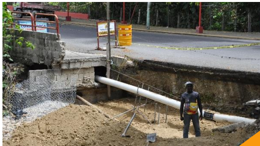
Construcción de gaviones y aceras en el entorno del hospital