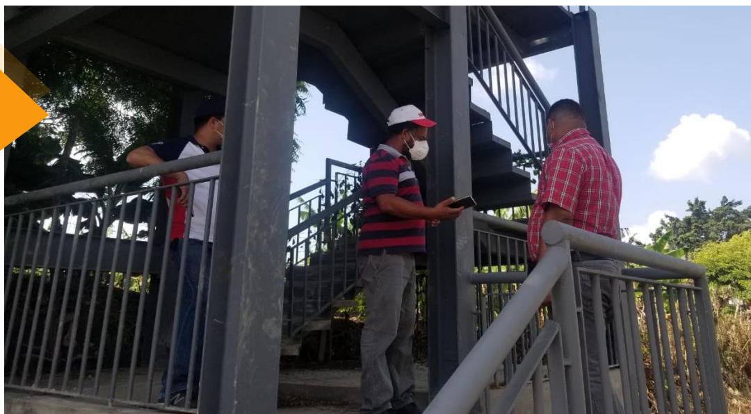
Ejecuciones finales para poner a funcionar el puente peatonal del Corozo (adyacente a la escuela).