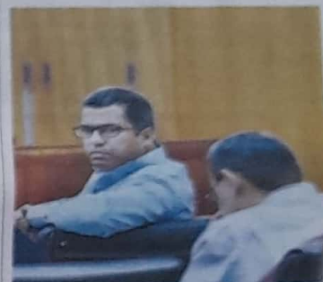
El juicio seguirá la semana próxima.