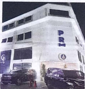
El PRM mantiene en incertidumbre la candidatura senatorial de la capital. FE

Los principales partidos han sido sometidos con recursos ante el Tribunal Superior Electoral (TSE), por dirigentes inconformes por el resultado de las encuestas que no les fueron favorables. La mayoría de los partidos mayoritarios optaron por hacer investigaciones de popularidad de sus aspirantes para completar la boleta electoral. El método es legal y está en la ley 33/18. YANESSI ESPINAL